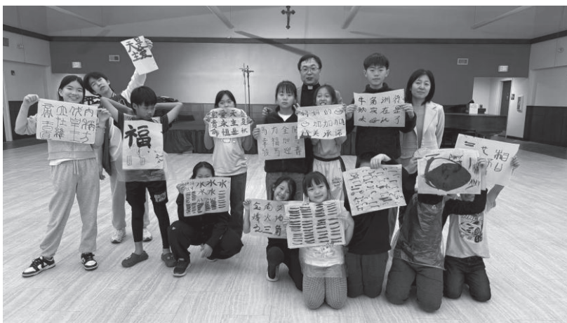
融愛之家——在青少年中傳揚中華傳統文化