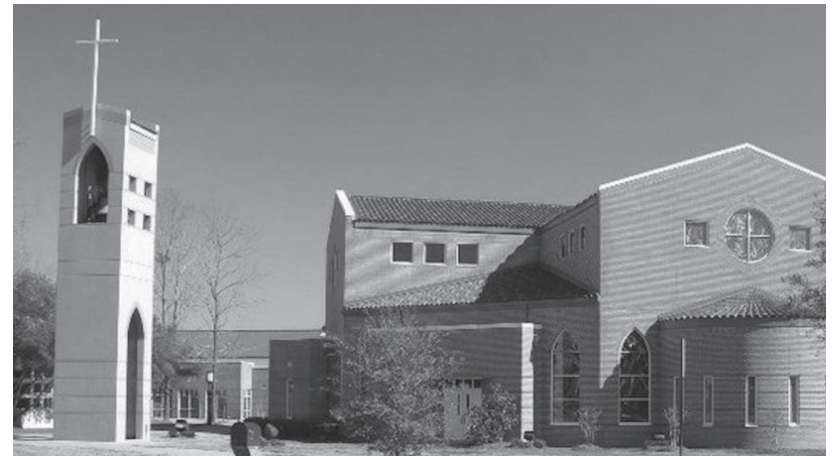
St. Francis of Assisi Catholic Church, Mississippi

I go to DBHS and my hobbies are taekwondo, kung fu, and marching band. I have made lots of friends after coming to California from all my extra-curricular activities. I completed in TDK nationals and got a silver medal. I have a small dog and a chinchilla that I love more than anything. My dog is very energetic and playful. He always cheers me up when I feel down and my chinchilla is small, playful, and very fluffy. Taking care of them has taught me lots of responsibility and knowledge about animals. Having two pets has made the house lively and fun.