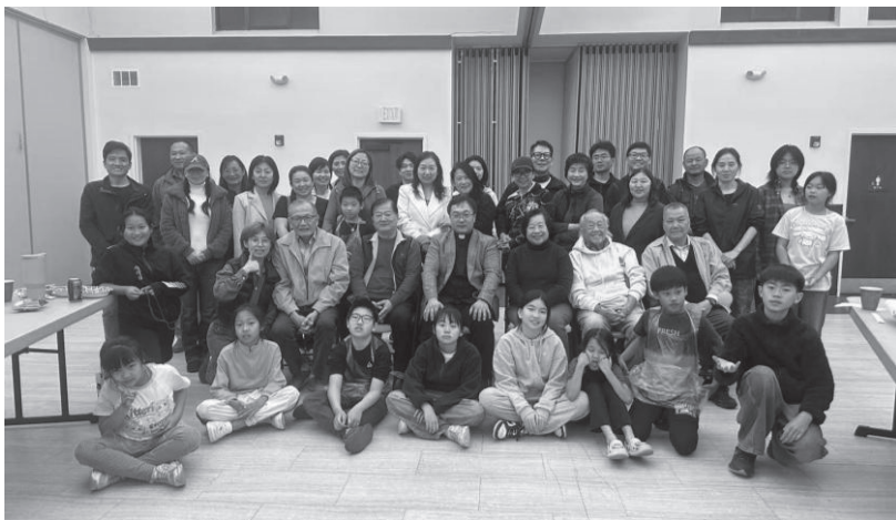
融愛之家——在老、中、青、幼中傳承信仰的種子