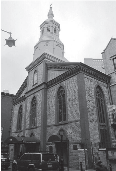
紐約顯聖容天主堂，Transfiguration Church, New York City

非常感恩，天主常常賜予我們平安和喜樂。願我們都能在主內成長，為悅樂天主而行！感謝天主！讚美天主！