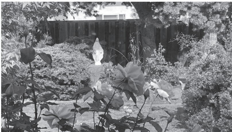
樹墩上的聖母態像