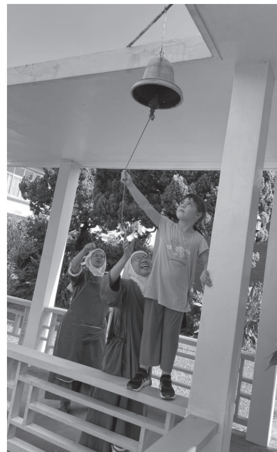
(晨星會的修女們與作者的孩子，是一段美好的際遇)

感謝天主，在這一次的搬遷中，為我把所有家具與物品，都找到新的家，也讓我的心重新騰出了空間，迎接新的祝福。