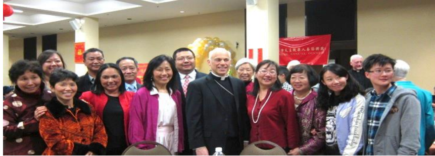
(天主教中半島華人團體教友通訊 168 期)