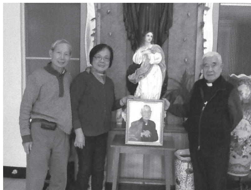
在聖心姚蒙席紀念室與狄剛總主教合影

感謝天主，祂餵養了我們，祂在最恰當的時機把我們帶到成功路程的最佳出發點，賜給我們力量，邁向成功之道。 (北加來稿)