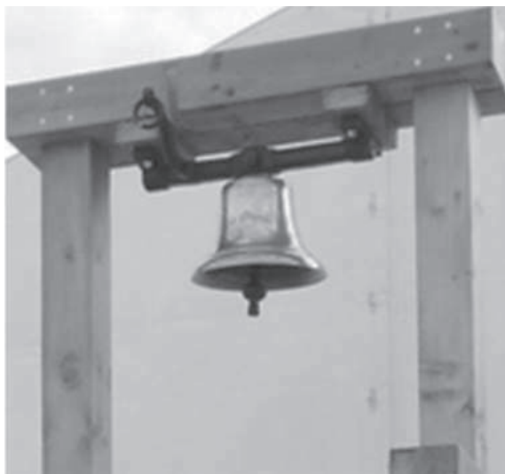
朝聖之鐘：聖體大會的象徵物

編註 1：愛爾蘭都柏林的總主教馬丁率團向時任教宗本篤十六世呈獻一座宏鐘。當鐘聲響起時，人們就被邀請、被召集，暫時放下俗務，一起來祈禱，革新精神，革新教會。 編註 2：動物在受造的過程不像人類的受造，尚似天主，被賦予靈魂生命。