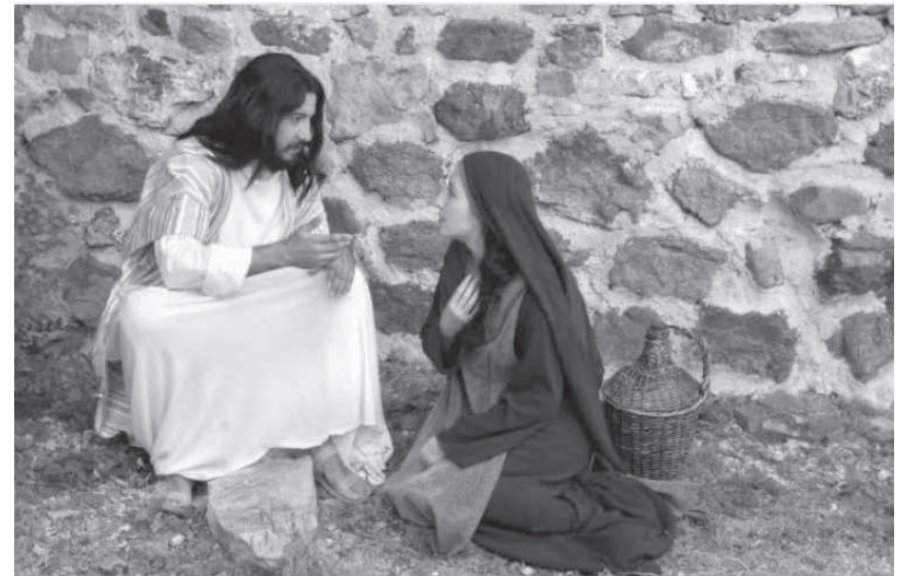
耶穌赦免罪人 悔改的罪人女人請求寬恕和醫治

所有人都無法避免有限生命的生老病死，但是我們可以向天主求平安喜樂。大愛的天主曾說過：你們求，我必給（瑪七 7）。在疫情持續蔓延與俄烏戰爭給全球帶來更多不確定性的今日，我們更要懇切地祈求慈悲而充滿大愛的君王，祂是一切美善的根源。救主手上的釘痕凸顯十字架的大愛。讓我們背起自己的十字架跟隨耶穌，在基督的愛內榮耀天主的偉大！