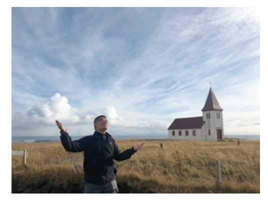
荒原中的老教堂/An Old Church in Wilderness Snæfellsnes Peninsula, Iceland 拍攝/撰文: 李芳宇 - 10/ 07/ 2018

兩年前在冰島旅行,偶遇一幢斑駁的老教堂,孤單佇立在遼闊的荒原中,似是一位獨行曠野的修道者,歷經考驗磨難。好奇地近前窺探,心情好似一朵野地的花,倚靠短牆生長,在安定靜謐地界,經風霜雨雪澆灌,陽光小雨滋潤,陣風搖曳欣喜,並與蟲鳥共舞;身臨其境之際,讚嘆天主恩賜的美好。