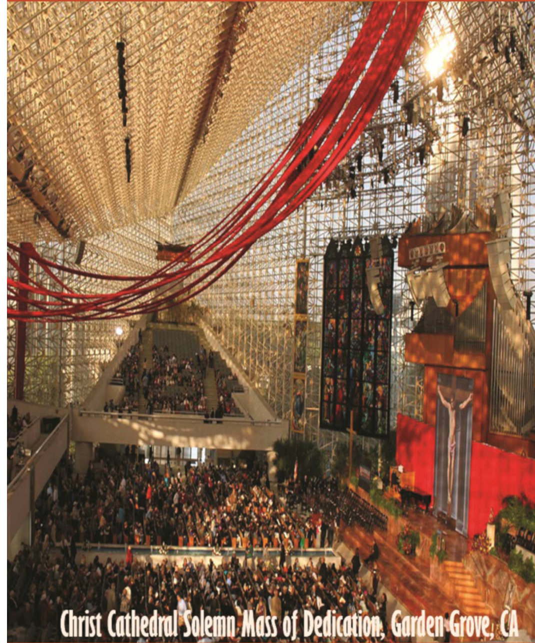
Christ Cathedral Solemn Mass of Dedication, Garden Grove, CA