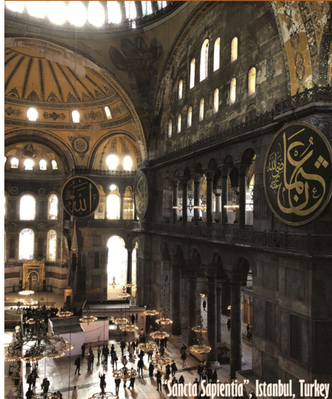
"Sancta Sapientia", Istanbul, Turkey