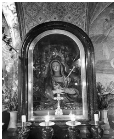
Church of Holy Sepulchre

千禧年（西元 2000 年）時曾赴以色列聖墓——當年耶穌基督背負着沉重的十字架，一步步艱難地走向加爾瓦略山在十字架上被釘死、安葬和復活的地方。當我進到苦路第十一處，紀念耶穌被釘上十字架的地點，排隊等著觸摸據說是當年豎立釘耶穌十字架的大理石圓孔時，全神注意著祭台後方的馬賽克圖——劊子手拿著鎚和釘把帶著刺冠的耶穌釘在十字架上，釘子深深地插入耶穌的雙手、雙腳。有位一起排隊的朋友小聲地要我看掛在祭台旁邊的「痛苦聖母像」——「西默盎的預言，有一把利劍將要刺透你（瑪利亞）的心靈」。當時我滿心停