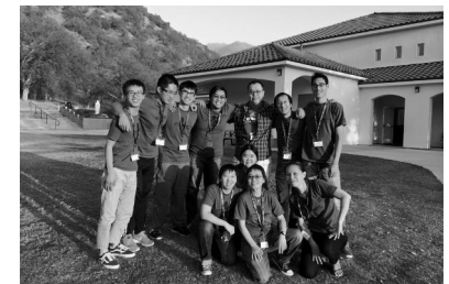
Firemark Young Adults at CACCLC 2015