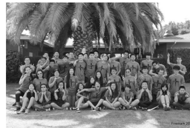
Firemark Summer Camp Group Picture 2015

So, if you know any high school students who are Catholic or who are interested in Catholic faith, please introduce them to Firemark. Our next camp will be on July 9 th to July 10 th , 2016. The camp will take place in the beautiful Mater Dolorosa Retreat Center in Sierra Madre.