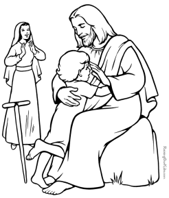
Jesus, God's Son, came to earth to help people everywhere.

我們何其有幸，有信仰常伴隨著我們。在這 次的「虛驚」中，我認識到天主給我的功課 就是不要害怕，依靠天主！祂永遠會給我們 某種驚喜！就因為這份不可預知的未來，讓 我更珍惜這「福份」，使我更會對自己的生 命和幸福負起責任。