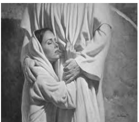
St. Mary Magdalene