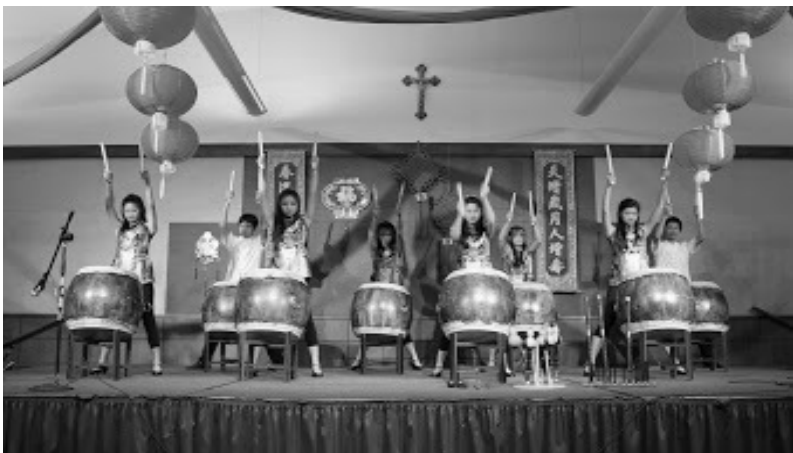
新年晚餐和餘興節目完美結束！ 大約有 220 餘人參與，有絲竹國樂社大鼓及國樂和中國民族舞蹈等演出，相當精彩！