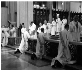
※五位新神父接受耶穌會弟兄神父們的覆手降福

刻印著一個碩大的紅字——「愛」。對了，就是這個愛，耶穌能肩負人類所有的罪孽，接受慘絕人寰的十字架苦刑，最後光榮地復活。這個愛，藉著每位神父、修女們無怨無悔的獻身，及每位跟隨者無私的事奉，「愛」，綿延不絕地傳承著。就在這兩天內，再次見證了！