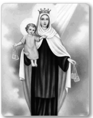
七月十六日 Our Lady of Mt. Carmel